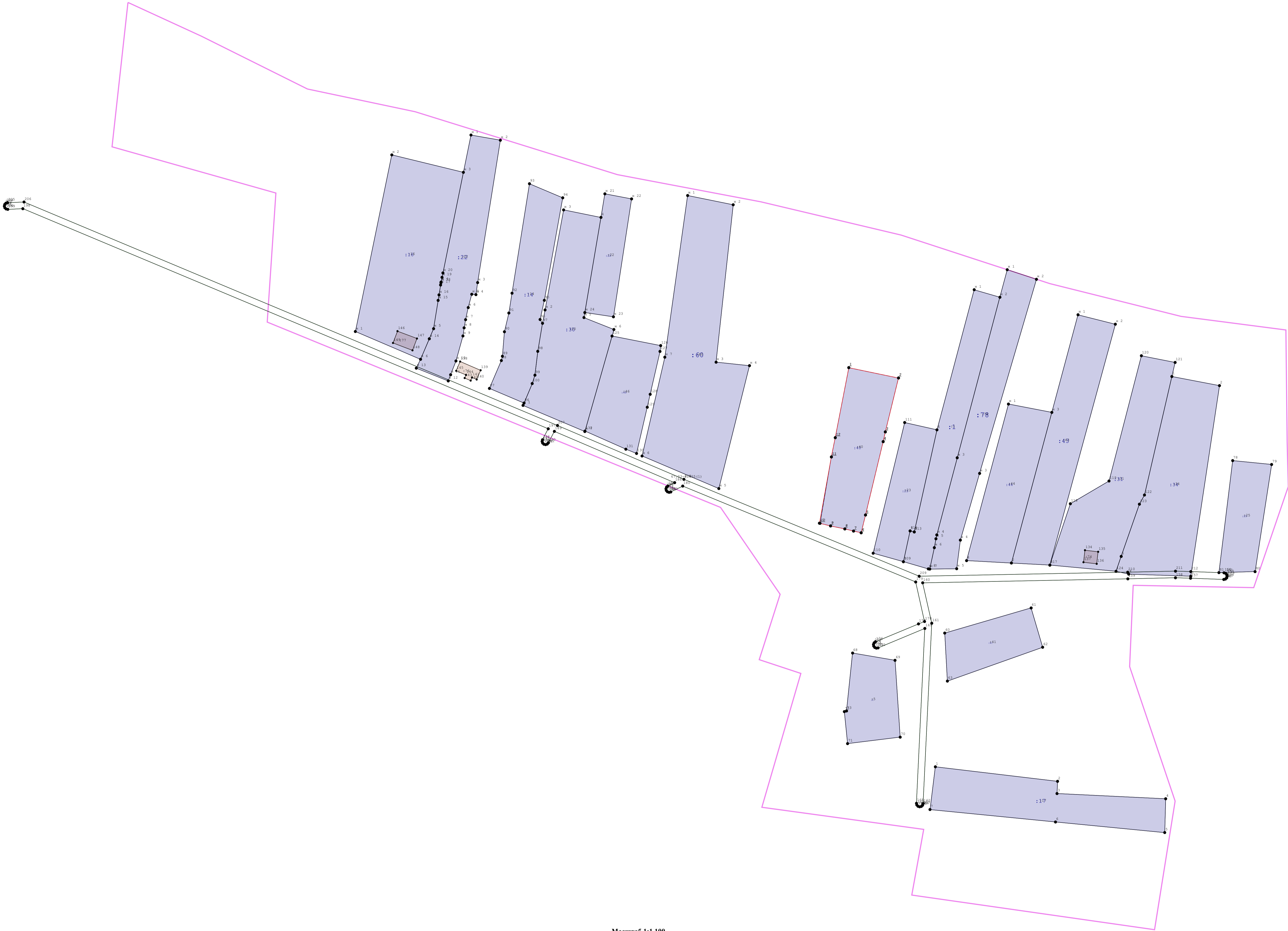
Масштаб 1:1 100